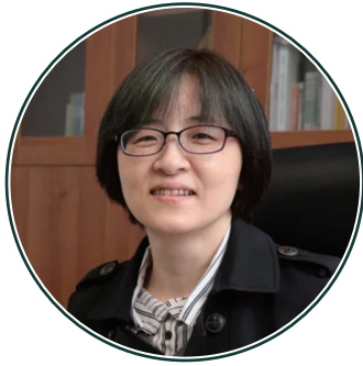
劉越萍 司長 衛生福利部醫事司司長